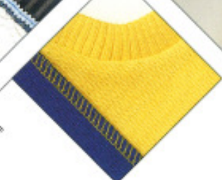
Overlock 2, Safety 4 Faden