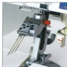
Hochklappbare Nadelklemme (eine Elna-Exklusivität)

Machen Sie sich auf künstlerische Meisterwerke gefasst, von denen Sie nicht einmal zu träumen gewagt haben.