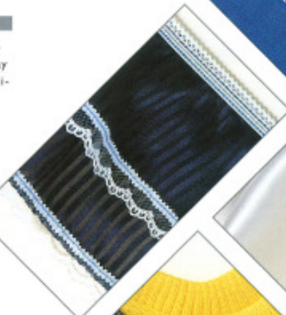
Aussetzen von Gummiband mit Decksaum