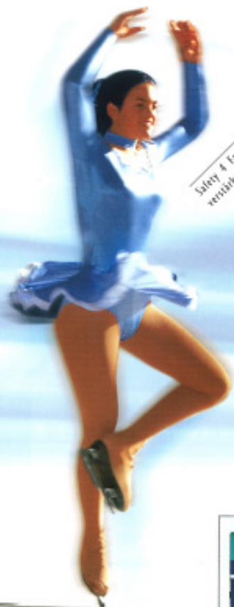
Safety 4 Faden, verstärkte Naht